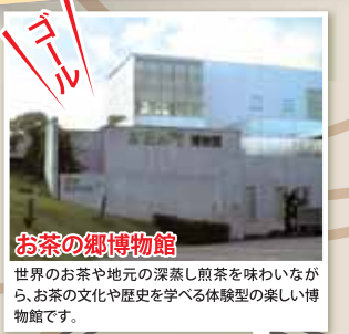
お茶の郷博物館 世界のお茶や地元の深蒸し煎茶を味わいながら、お茶の文化や歴史を学べる体験型の楽しい博物館です。