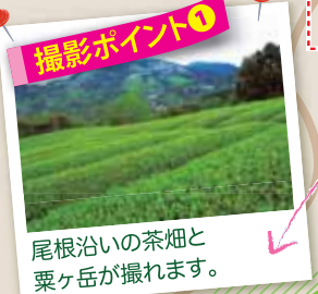
撮影ポイント① 尾根沿いの茶畑と粟ヶ岳が撮れます。