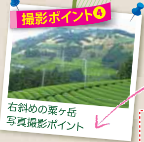
撮影ポイント④ 右斜めの粟ヶ岳写真撮影ポイント