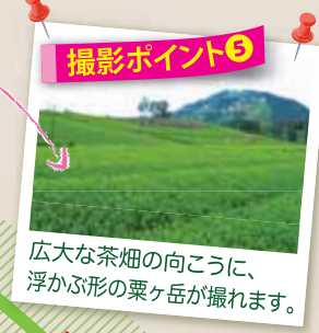
撮影ポイント⑤ 広大な茶畑の向こうに、浮かぶ形の粟ヶ岳が撮れます。